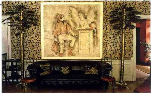
Maison de Jean Cocteau à Milly-la-Forêt : le salon, avec le tableau de Christian Bérard, Édipe et le Sphinx jouant aux cartes.

La Villa Sauber, l'un des deux volets du projet muséographique monégasque réuni en un Nouveau Musée National de Monaco (NMNM), a ouvert ses portes le 8 juin. C'est une des dernières villas Belle Époque de Monaco, propriété, avec des éclipses, du peintre londonien Robert Sauber, entre 1904 et 1930. Rachetée en 1969 par l'État monégasque, devenue musée de poupées anciennes et de miniatures, elle a aujourd'hui vocation à devenir un espace de dialogue entre héritage historique et contemporanéité. Pour la première exposition, l'artiste britannique d'origine nigérienne Yinka Shonibare a été invité :