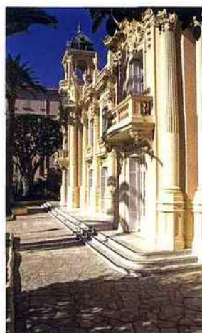
La Villa Sauber abrite une partie du Nouveau Musée National de Monaco.

Milly-la-Forêt, Maison Jean Cocteau - 15, rue du Lau (01 64 98 11 50 - www.jeancocteau.net ).